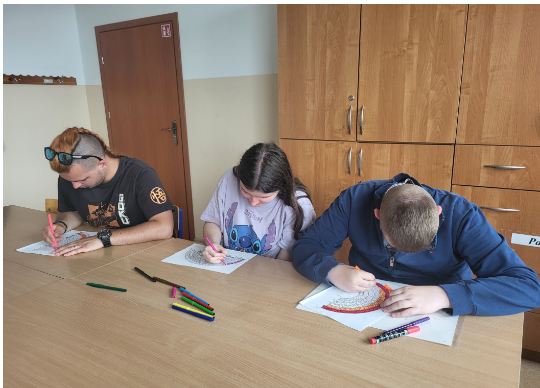
Dopasowanie ubrania do pory roku i pogody.