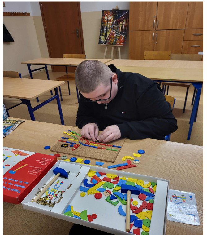
Układanie puzzli wieloelementowych.